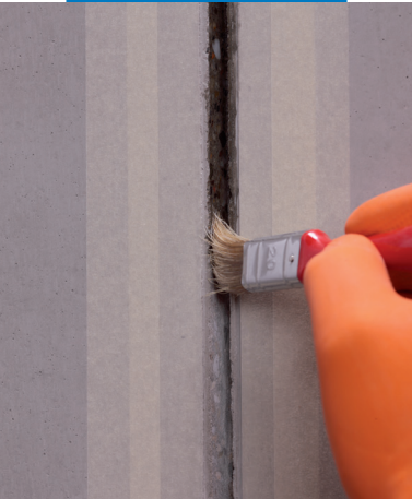
Aplicación de Primer M