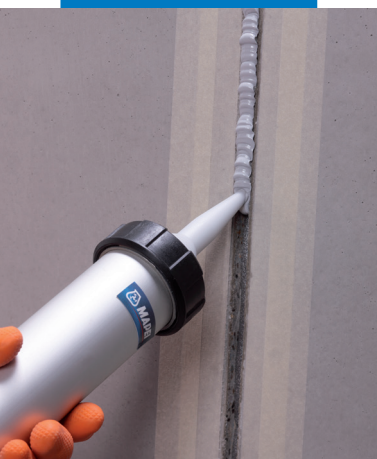
Aplicación de Mapeflex PU40

sólidas, sin polvo y partes desmoronables, exentas de aceites, grasas, ceras y viejas pinturas. Para permitir al sellador desarrollar su función, es necesario que la junta pueda expandirse y contraerse libremente; por ello es indispensable que Mapeflex PU40 se adhiera perfectamente sólo en las paredes y no en el fondo de la junta.