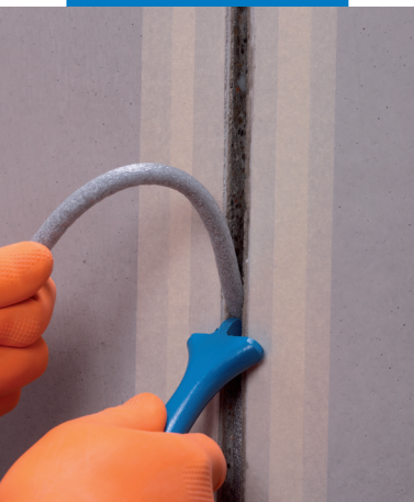
Insertar Mapefoam en el interior de la sede de la junta