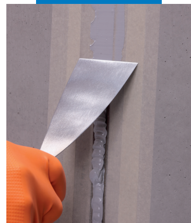
Alisado de Mapeflex PU40